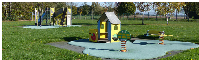
Accueil de Loisirs de La-Trinité-Parhoët

Les accueils de loisirs sont également appelés accueils collectifs de mineurs. Encadrés par des animateurs, vos enfants sont accompagnés en groupe, sur des projets communs, des activités ou des sorties à la journée ou en mini-camp.